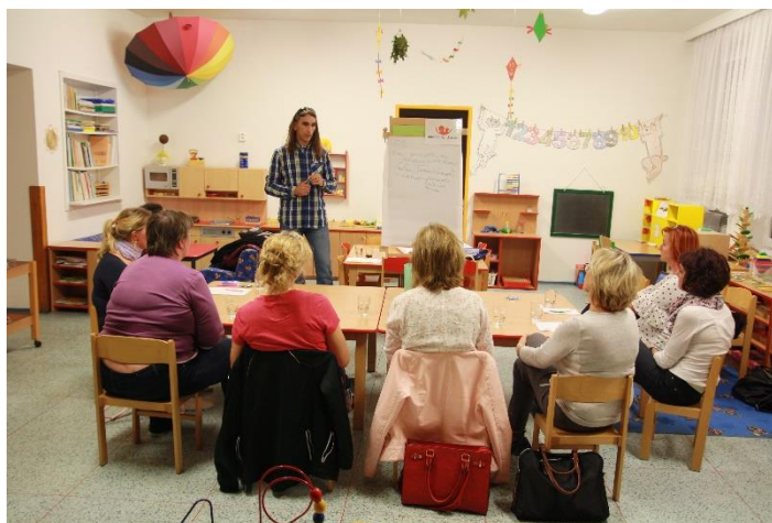
Mezioborové setkání TOD.